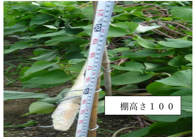
① ②は立体 ③は平畝