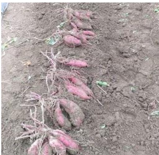
1本の弦に1個だけでした なぜか？